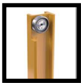
ลิฟท์ยกพร้อมลูกปืน ลูกกลิ้งทรงกระบอกเรเดียล