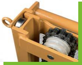
โปรไฟล์เหล็กกรัดร้อน