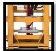
อุปกรณ์ยึดคั่น เกียร์ด้านข้าง